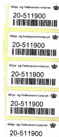
Figur 3: Eksempel på prøvetagnings- nummer.

Landbrugsstyrelsen / Industrihamp kontrolinstruks 2024 / 9